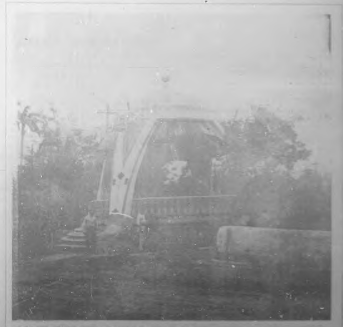
Kiosko de la Directiva de la Exposición.-Por Mario Botlan.

De todos modos, en sus nombres todos los expositores.