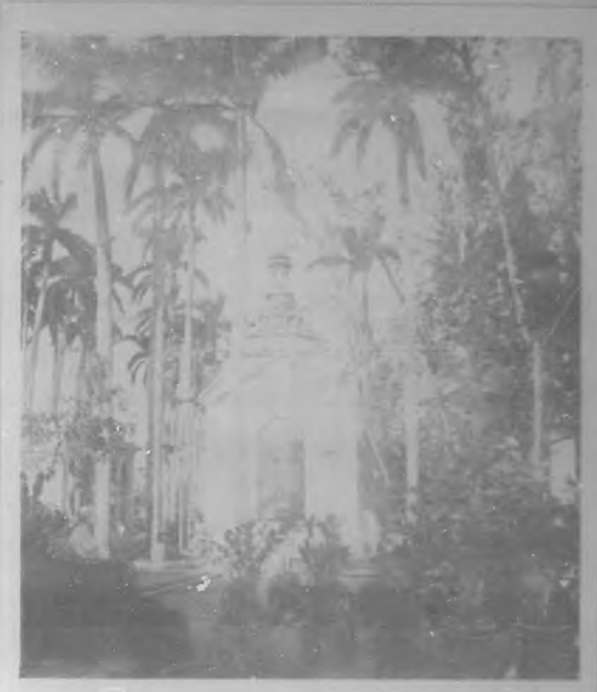
Pabellón de la provincia de la Habana