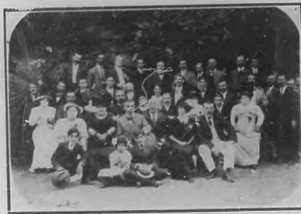
Grupo de asistentes á la fiesta valenciana-murciana celebrada en La Tropical el pasado domingo con asistencia del señor Ministro de España y otras distinguidas personalidades.