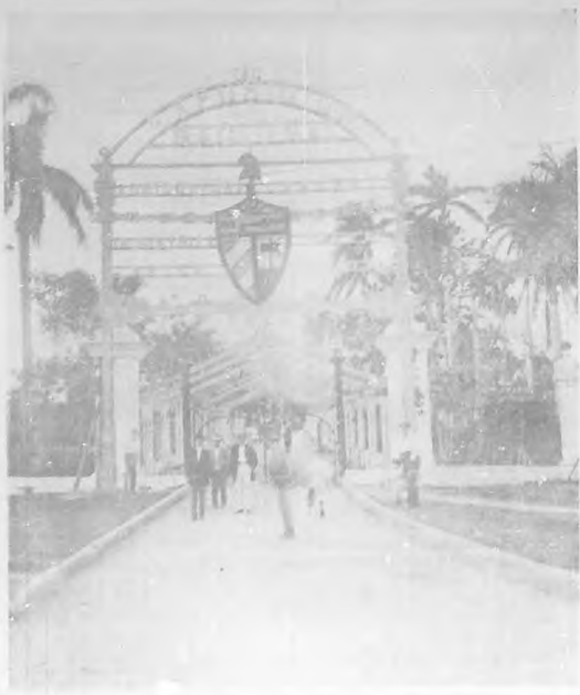
Entrada a la Exposición