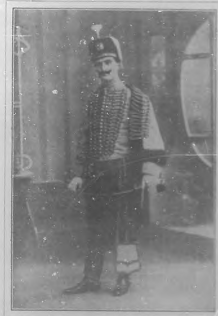
Emilio Sagi Barba.

Es tal la seguridad que tiene Sagi Barba en sus fuerzas que se permite entrometerse en "particellas" de tenor y apropiárselas. Y aun que de momento el oído se resista á oír de distinto modo trozos que sabía de otra manera, se rinde y entrega fácilmente.