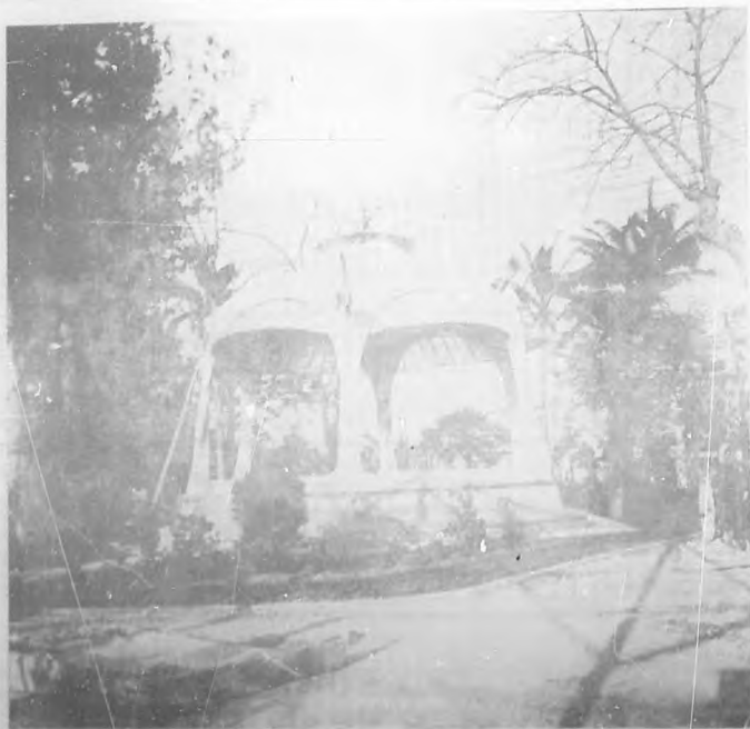
Kiosko de la música.-Por Mario Botlan.