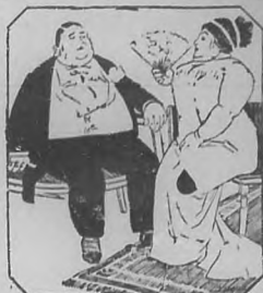
La gordura es peligrosa y ridícula